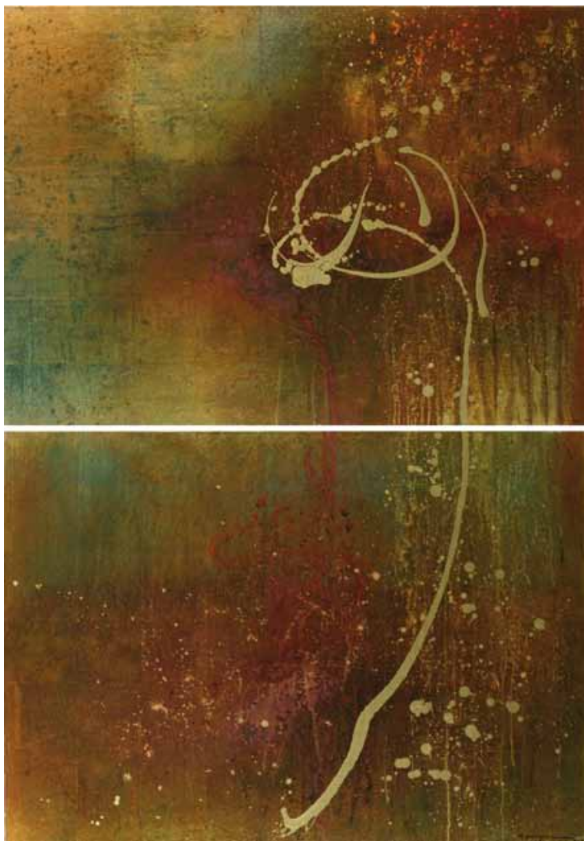
TRANSMUTACIÓN 200 X 140 CM (díptico)

Su obra se caracteriza por un amplio manejo de los metales y un conocimiento de pátinas e interesantes reacciones químicas, que le han permitido desarrollar una rica y única paleta de colores y texturas con materiales tales como la hoja de oro, la plata, el aluminio, el cobre, el bronce y el latón; los que, en su manejo y transformación, constituyen lo que bien podríamos llamar: "una propuesta de Alquimia para el siglo XXI".